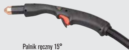
Palnik ręczny 15°