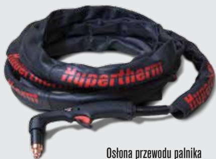
Osłona przewodu palnika