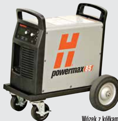
Wózek z kółkami