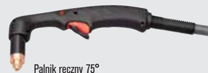
Palnik ręczny 75°

(więcej opcji palników można znaleźć w witrynie www.hypertherm.com )